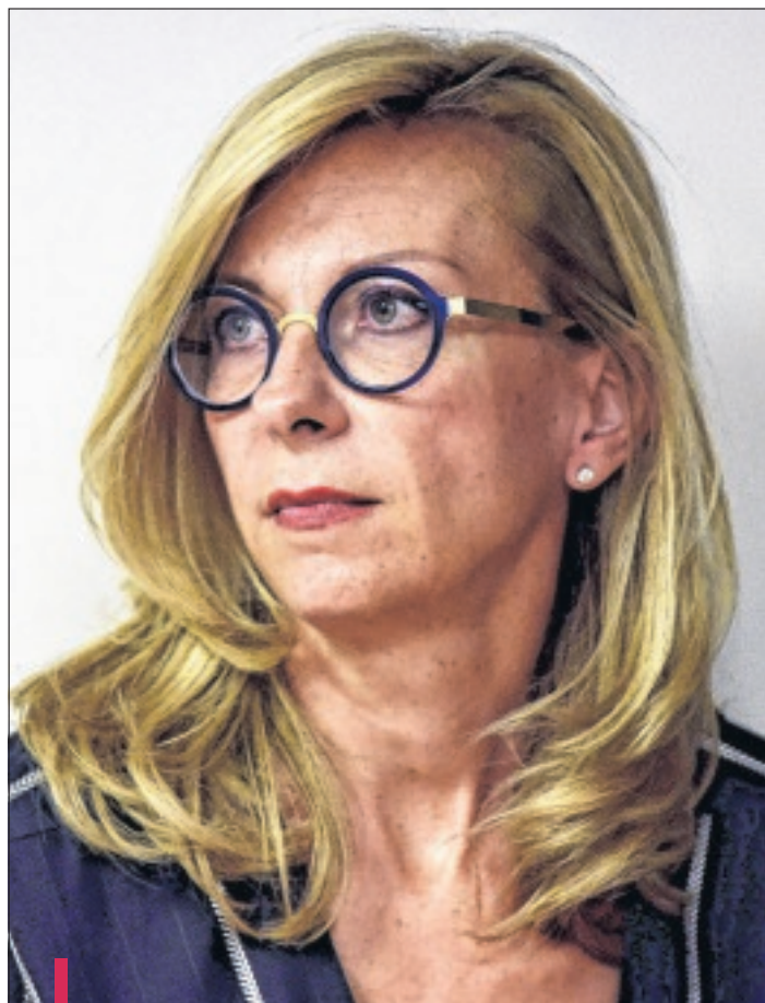
Natalie Dessay : "Je compare souvent le chant à la course".

Ce violoncelliste, entrepre-neur et producteur de concerts, a entrepris son pé-riple le 18 avril dernier, parti de Montgeron pour alerter sur le sort des artistes (lire ci-des-sous). Natalie Dessay est la mar-raise de cette opération #je-courspourlaculture. Celle qui est aujourd'hui également comédienne (on l'a vue en 2018 au Festival d'Avignon), qui a élargi son répertoire et dont deux compilations de ses plus beaux rôles viennent de sortir, comprend néanmoins le dan-ger que représente le virus et par conséquent les décisions qui ont pu être prises par l'État.