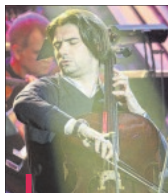
Gauthier Capuçon, à Arles et à La Ciotat.